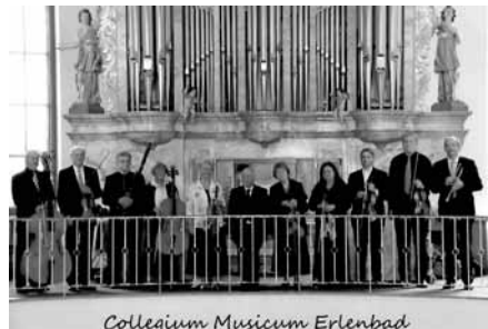
Collegium Musicum Erlenbad

Spenden zugunsten des Klosters Marienburg werden gerne entgegengenommen.